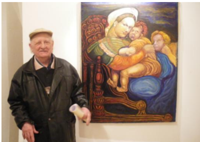
Camille URIBES « Vierge à l'Enfant », d'après Raphaël